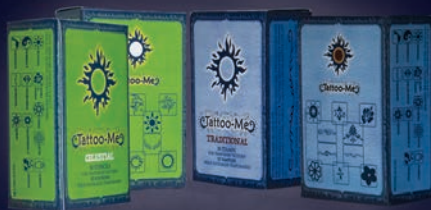
STENCILS & TATTOO-ME STAMPS FOR BODY ART POCHOIRS ET TATTOO-ME TAMPONS POUR DECORATION CORPORELLE