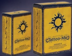
GENIPA AMERICANA (JAGUA)